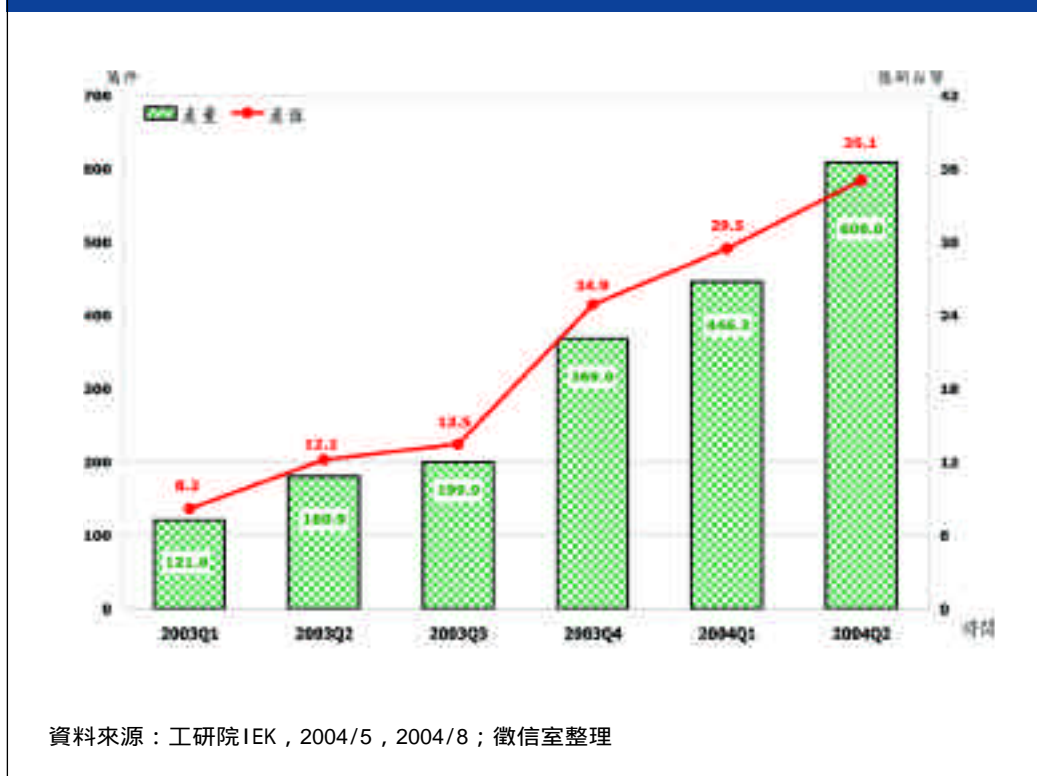
圖二 2003年 / 2004上半年我國藍芽產品產量與產值統計

者重點發展項目,也因此2004年上半年耳機麥克風銷售值比重仍高居榜首且大幅上揚(由2003年的30%提升至2004年上半年的48.9%),其次便是USB傳輸介面及其周邊商品(如PC用之滑鼠、鍵盤、耳機等),但由於此領域產品對台灣業者而言開發成本低、開發時間也較短,競價結果造成價格偏低,廠商獲利有限,多藉由薄利多銷的方式發揮「替代」傳統滑鼠、鍵盤及其他有線設備市場的效果。