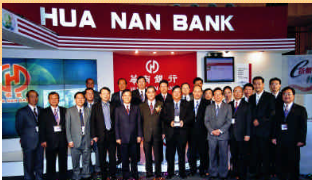
華銀團隊於「亞太電子商務大展」本行「金流」主題館合照。