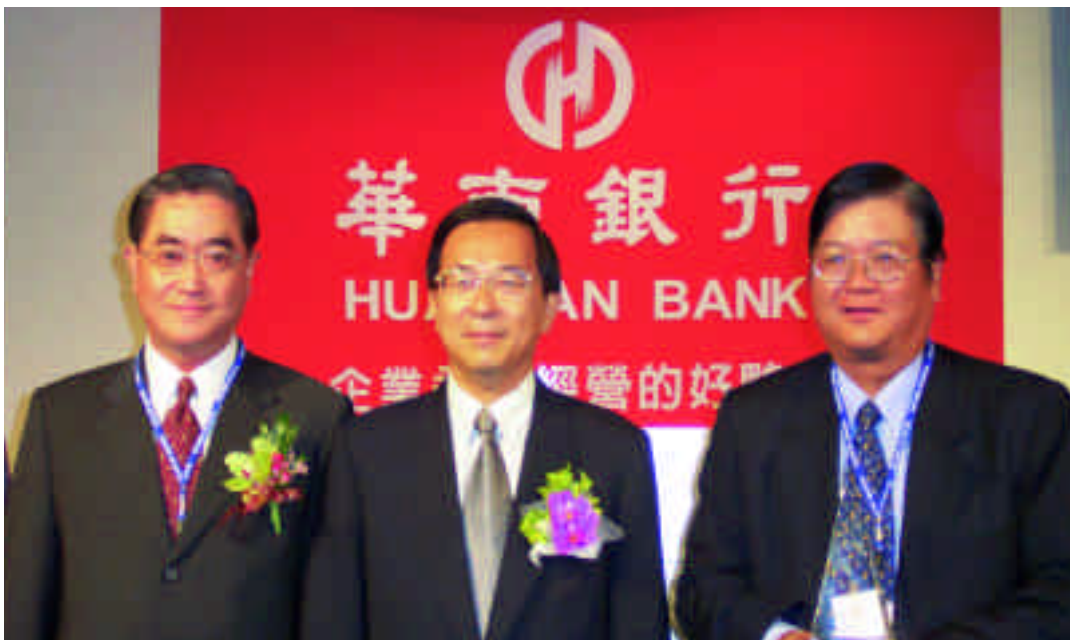
陳水扁總統（中）、董事長林明成（左）、總經理許德南（右）於華銀「金流」主題館合影。

註：AFACT為聯合國UN/CEFACT於1990年在亞洲所設立之非營利與非政府組織，主要目的在推動亞太地區電子商務、貿易便捷化以及標準建立之工作。