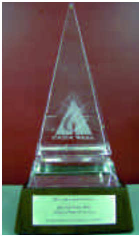
◀ AFACT亞太電子化成就獎獎盃